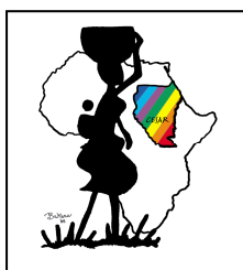
Associazione CESAR Onlus